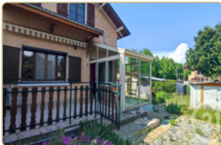
PONTCHARRA DPE : E - GES : D