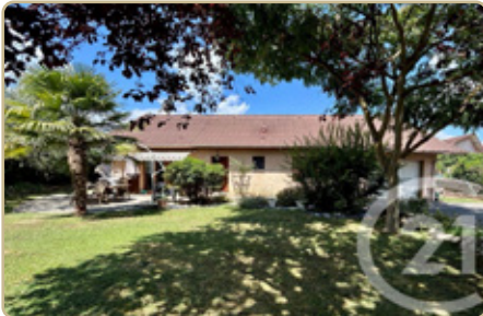
DRUMETTAZ CLARAFOND DPE : C - GES : C