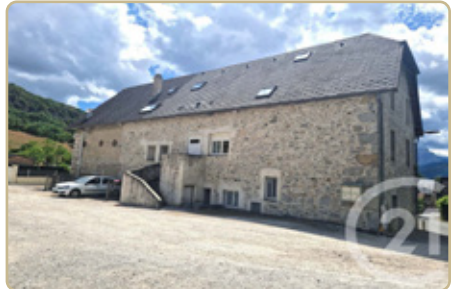
ST-ALBAN LEYSSE DPE : D - GES : D