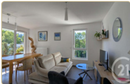
COGNIN DPE : C - GES : C