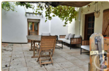
CHAMBERY DPE : F - GES : C