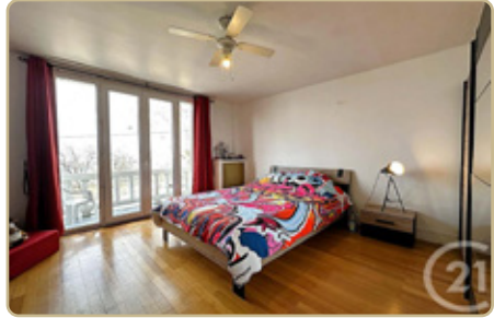
CHAMBERY DPE : C - GES : C