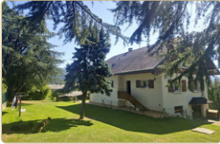
STE-HELENE DU LAC DPE : D - GES : B