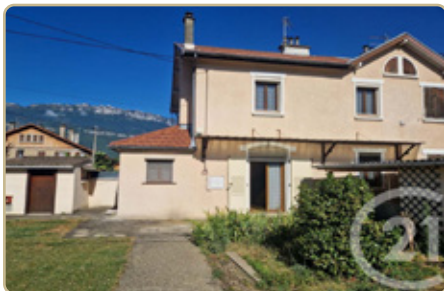
PONTCHARRA DPE : E - GES : D