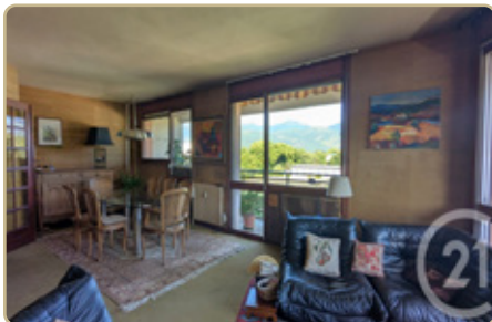
CHAMBERY DPE : D GES : C