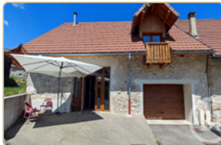
SAINTE-MARIE DU MONT DPE : D GES : B