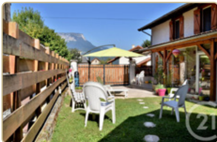
PONTCHARRA DPE : E GES : D